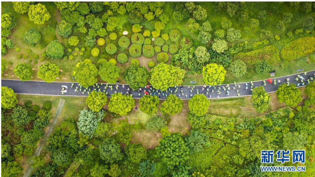
在江苏省淮安市，体育爱好者在淮安森林公园进行“全民健步走”活动（8月7日摄，无人机照片）。