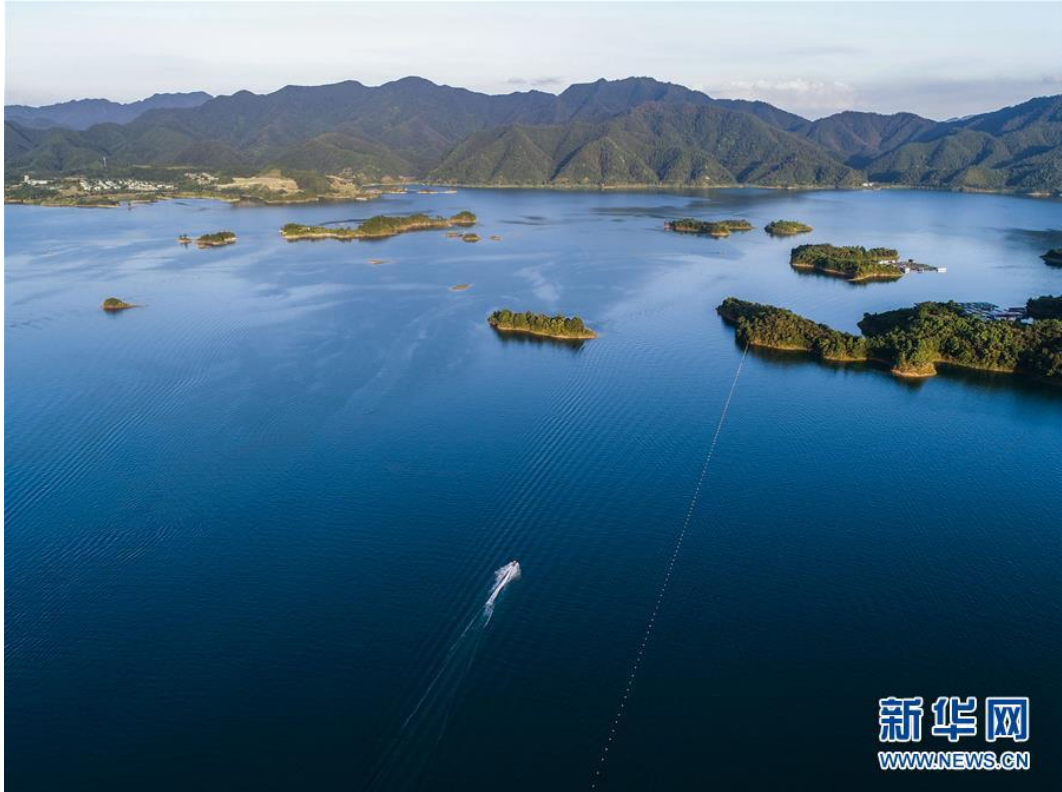
空中俯瞰杭州市淳安县千岛湖（2018年7月18日摄，无人机照片）。