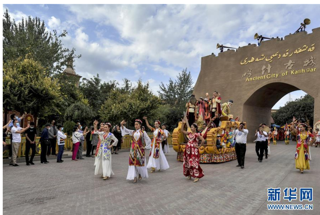
新疆喀什古城景区举行开城仪式，欢迎游客入城游览（9月11日摄）。

面对历史的重托、人民的期待，习近平总书记以强烈的使命感责任感，登高望远、运筹帷幄。